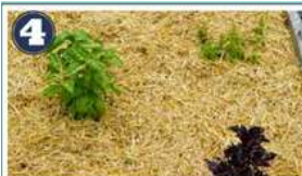
PAILLAGE DES MASSIFS