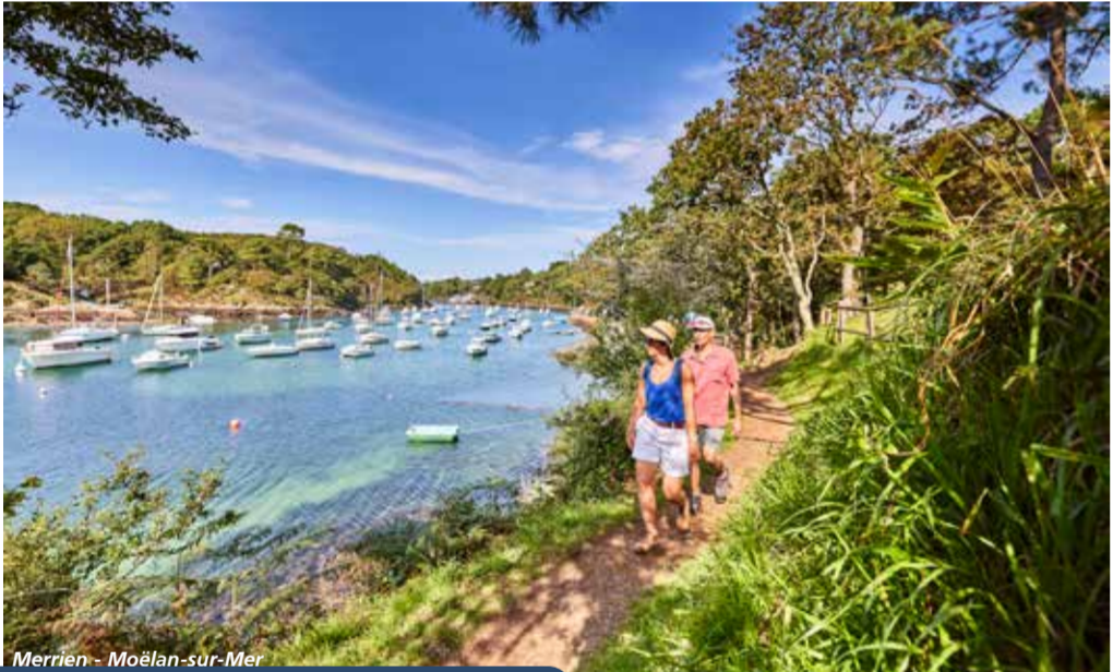
Merriën - Moëlan-sur-Mer

Cet itinéraire chargé d'histoire et balayé par les embruns est l'une des plus belles façons de découvrir le département.