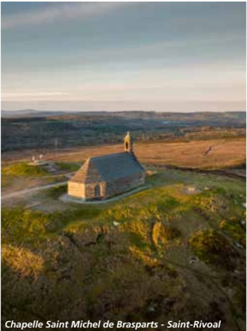
Chapelle Saint Michel de Brasparts - Saint-Rivoal

The hiking starts at the Pointe de Pen-Hir, a high up rocky outcrop in the Presqu'île de Crozon, overlooking the Tas de Pois, those huge rocks that look like dots in the sea. The path then heads towards Landevennec and then goes to Le Fauou and the forest of Cranou on the foothills of the Monts d'Arrée. Stop at Saint-Rivoal at the Maison Cornec, a typical house from this region. After a few kilometers, the path reaches the Montagne Saint Michel from where you can see Finistère, moors and bogs, the lake of Brennilis. Find the same natural beauty in Huelgoat before arriving in Carhaix-Plouguer where you'll discover the ruins of the Gallo-Roman city of Vorgium.