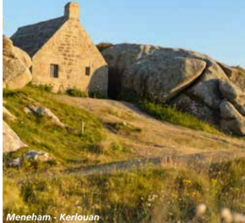
Meneham - Kerlouan

Le GR®37 relie le Mont Saint-Michel à la pointe de Pen-Hir, à Camaret-sur-Mer. La randonnée se déroule en plein cœur du Parc naturel régional d'Armorique à la géographie si singulière, créant ces ambiances tantôt maritimes, tantôt « montagnardes ». Des trésors géologiques que l'on imagine à peine ponctuent le parcours comme sur la Presqu'île de Crozon ou les crêtes des Monts d'Arrée.