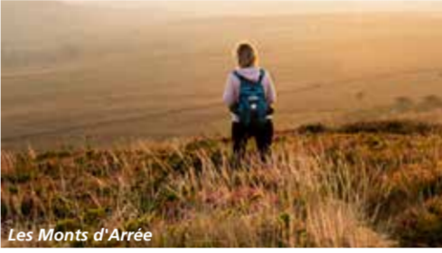
Les Monts d'Arrée

GR®, GR® de Pays et Labellisé FFRandonnée® sont des marques déposées par la FFRandonnée, elles désignent les itinéraires créés par la FFRandonnée et identifiés sous le nom de "GR®", balisés de marques blanc-rouge, "GR® de Pays", balisés de marques jaune-rouge ainsi que les PR "Label-