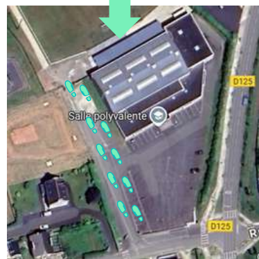
ESPACE VALÉRIE BRETON

L'assemblée générale de l'association Henchou Gwechall se tiendra le vendredi 21 mars à 18h30 à l'espace Valérie Breton (dans la salle omnisport). Une occasion pour vous de vous informer, de soutenir les activités de l'association et peut-être aussi d'y adhérer, un rajeunissement de l'équipe serait apprécié.