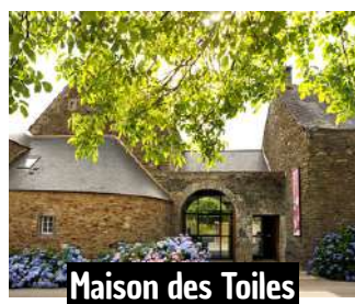
Maison des Toiles

Sortie prévue le mardi 12 mai : La Route du Lin Le matin : visite guidée de la Maison des Toiles à Saint-Thélo, pour découvrir l'histoire du lin qui a fait la renommée du Centre-Bretagne. L'après-midi : accueil et visite guidée d'un atelier de tissage à Uzel. Les inscriptions sont possibles dès maintenant au club, actuellement Espace Valérie Breton, derrière la salle omnisports. Renseignements Sylviane Gautier ☎ 06.73.80.91.31.