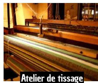
Atelier de tissage