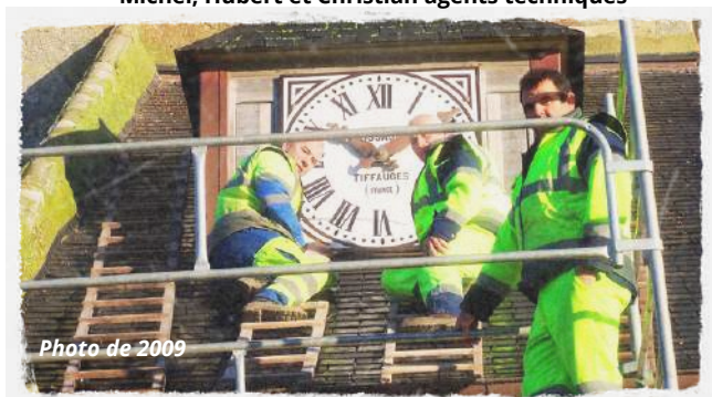
Photo de 2009