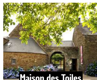
Maison des Toiles