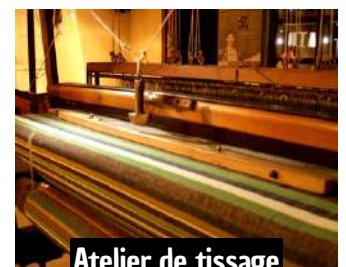
Atelier de tissage